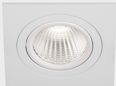
rebecca sq K53271.01.RF.WH-WH.35.ST.9.40.DA