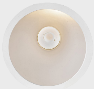
noon IP65 K50803.02.RF.WH-WH.38.ST.8.40