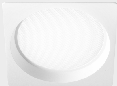
lim sq K50321.04.RF.WH-WH.MP.ST.8.30.DA