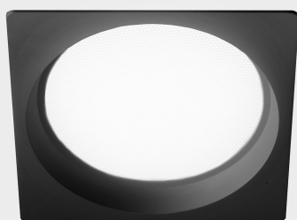
lim sq K50321.02.RF.BK-BK.MP.ST.8.30.DA