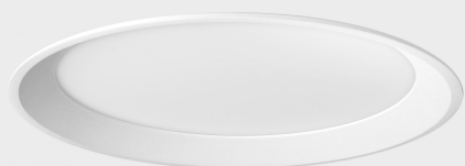
lim miranda K53100.02.RF.WH-WH.OP.ST.8.40.DA