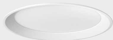
lim miranda K53100.01.RF.WH-WH.OP.ST.8.40.PU