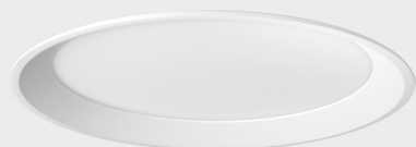
lim miranda K53100.01.RF.WH-WH.OP.ST.8.40.D1