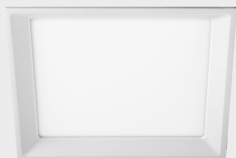
lim miranda sq K53105.01.RF.WH-WH.OP.ST.8.40.DA