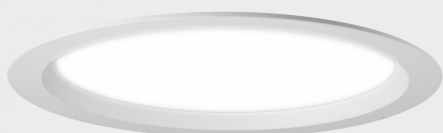
lim lacus K53300.03.RF.WH-WH.OP.ST.8.30