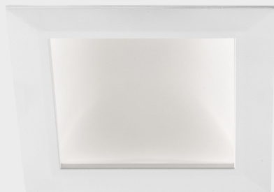
disc tina deep sq K50415.02.RF.WH-WH.ST.8.30.DA