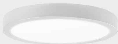
disc slim K51700.05.SR.WH-WH.OP.ST.8.30.DA