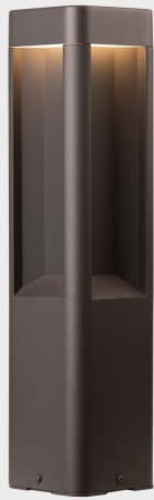
senda floor K60500.03.FL.DG-DG.ST.8.30