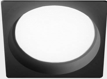
lim sq K50321.03.RF.BK-BK.MP.ST.8.30.PC