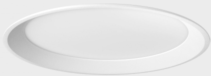
lim miranda K53100.02.RF.WH-WH.OP.ST.8.40.DA