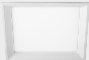
lim miranda sq K53105.02.RF.WH-WH.OP.ST.8.40.DA