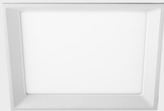
lim miranda sq K53105.01.RF.WH-WH.OP.ST.8.30.PC