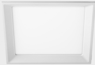
lim miranda sq K53105.01.RF.WH-WH.OP.ST.8.30.DA