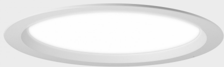
lim lacus K53300.03.RF.WH-WH.OP.ST.8.40.DA