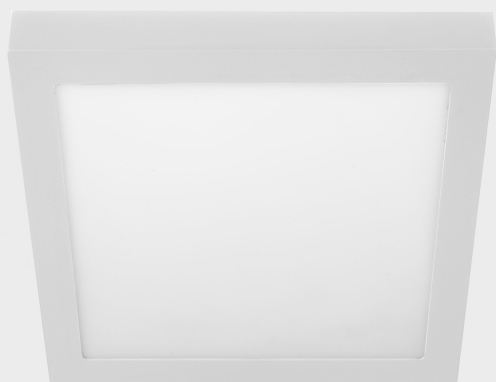
disc slim sq K51701.05.SR.WH-WH.OP.ST.8.30.DA